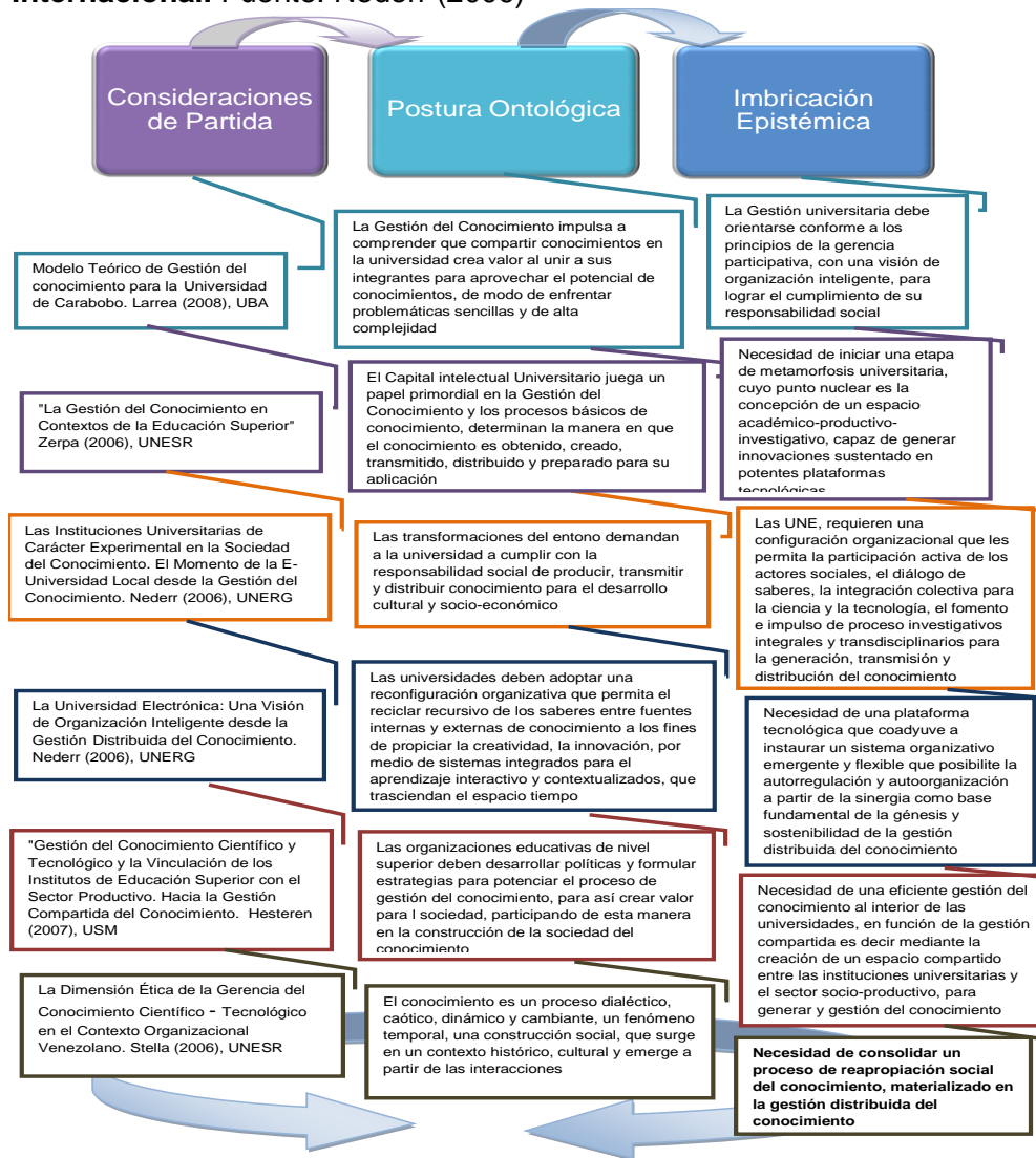
Figura Nº 2 Entramado Relacional de las Investigaciones Previas. Contexto Nacional.