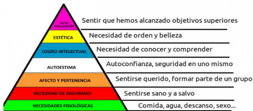
Figura 4. Jerarquía de las necesidades humanas