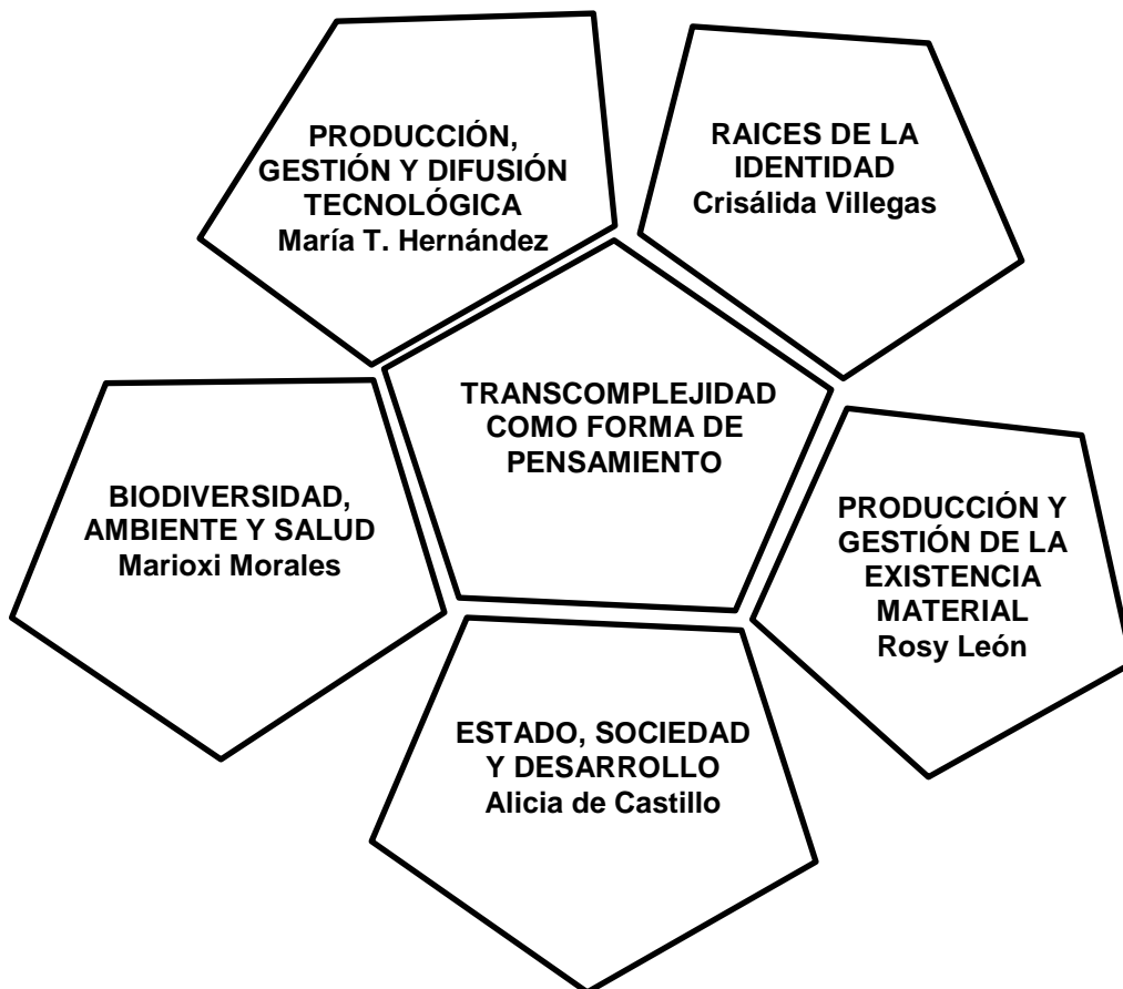
Figura 2. Líneas de Investigación Institucional

A partir de enero 2015 se restituye el cargo de Dirección de Investigación y se conforma un equipo de tres personas que se organizan alrededor de tres áreas: Líneas de Investigación, Formación en Investigación y Publicación. En cuanto a las Líneas de Investigación se reestructura el equipo de Coordinadores de Líneas de Investigación tanto Institucional como del Doctorado. En el último trimestre del año 2015 se crean cuatro nuevas Líneas de Investigación Institucional, las cuales de las ya cinco tradicionales se muestran en la figura 2