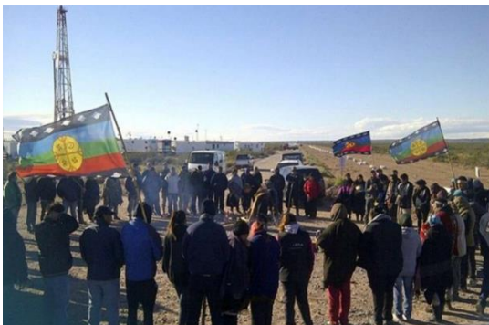
Pueblo Mapuche Buenos Aires

La necesidad de prever, este tipo de conflictos, que escapan evidentemente del plano tecno-económico y por tanto cuantitativo, amerita la integración de equipos donde participen sociólogos, psicólogos, agrónomos, veterinarios, médicos, especialistas en economía social, que puedan ofrecer respuestas oportunas y que ayuden a evitar o mitigar inconvenientes o daños patrimoniales significativos.