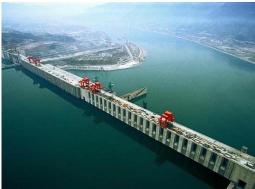
Represa de las tres Gargantas en China

Buena parte de estos problemas, no fueron abordados por los proyectistas desde un principio, lo que ha originado innumerables críticas por el daño causado al patrimonio cultural de la humanidad.