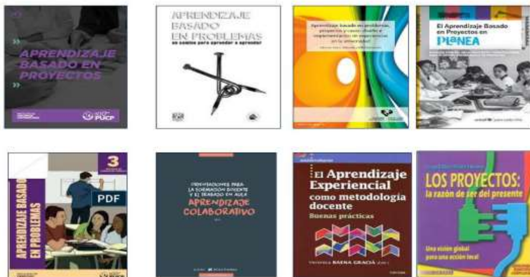
Figura 1. Portadas de libros referidos a aprendizaje basado en proyectos

con fechas de edición de entre los años 2013 al 2021, la mayoría de estos últimos dos años, lo que significa que la UBA está en la vanguardia.