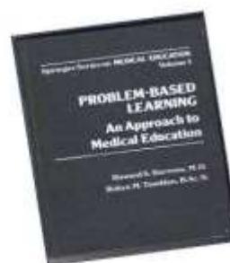
Figura 2. Origen del Aprendizaje basado en proyecto

Entonces lo primero es aclarar que ABP ahora ABEP es una estrategia y a la vez un tipo de aprendizaje. De este punto de vista, cumple varias funciones como: (a) recurso pedagógico es una oportunidad de aprender; (b) como metodología pedagógica es una forma de aprender haciendo y (c) como instrumento de evaluación construye evidencias de aprendizaje con altos criterios de validez.