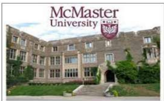
Facultad de Ciencias de la Salud