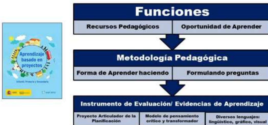
Figura 3. Funciones del ABEP

Por otra parte, existe una evidente correlación entre la metodología de aprendizaje basada en proyecto (ABP), con el aprendizaje experiencial (AE), basado en problemas (ABp), basado en retos (ABR) colaborativo (AC) y aprendizaje invertido (AI) derivado de la ingeniería invertida. También se puede hablar de aprendizaje basado en descubrimiento (ABD), Aprendizaje-Servicio (ApS), aprendizaje dialógico (AD) y aprendizaje basado en investigación (ABI). Como ya se dijo cada uno de estos planteamientos puede ser asumido como una metodología de aprendizaje, pero también como un determinado tipo de aprendizaje, que se genera al utilizar esa metodología. Lo planteado se representa en la figura 4, destacando en cada caso los principales procesos que caracterizan cada metodología.