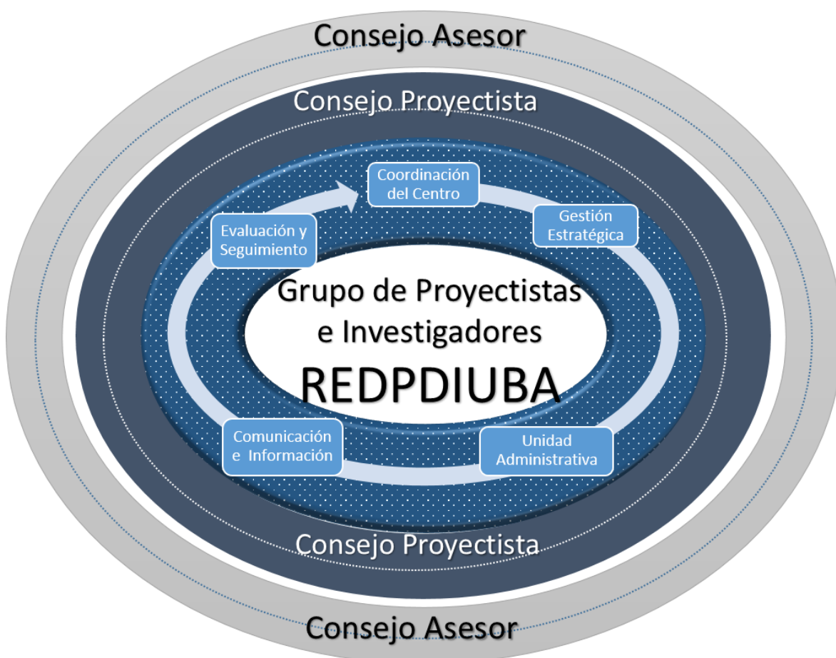
Esquema 2. Estructura del Centro de Proyecto

El modelo de estructura que se plantea es la organización matricial-proyecto, considerando que el Centro está adscrito a una universidad privada, por lo que su talento humano forma parte de la universidad y posiblemente tenga alguna otra responsabilidad. En tal sentido, a continuación, se muestra el esquema 2 referido a la estructura del Centro de Proyecto y el cuadro 1, presenta una propuesta de perfil y funciones.