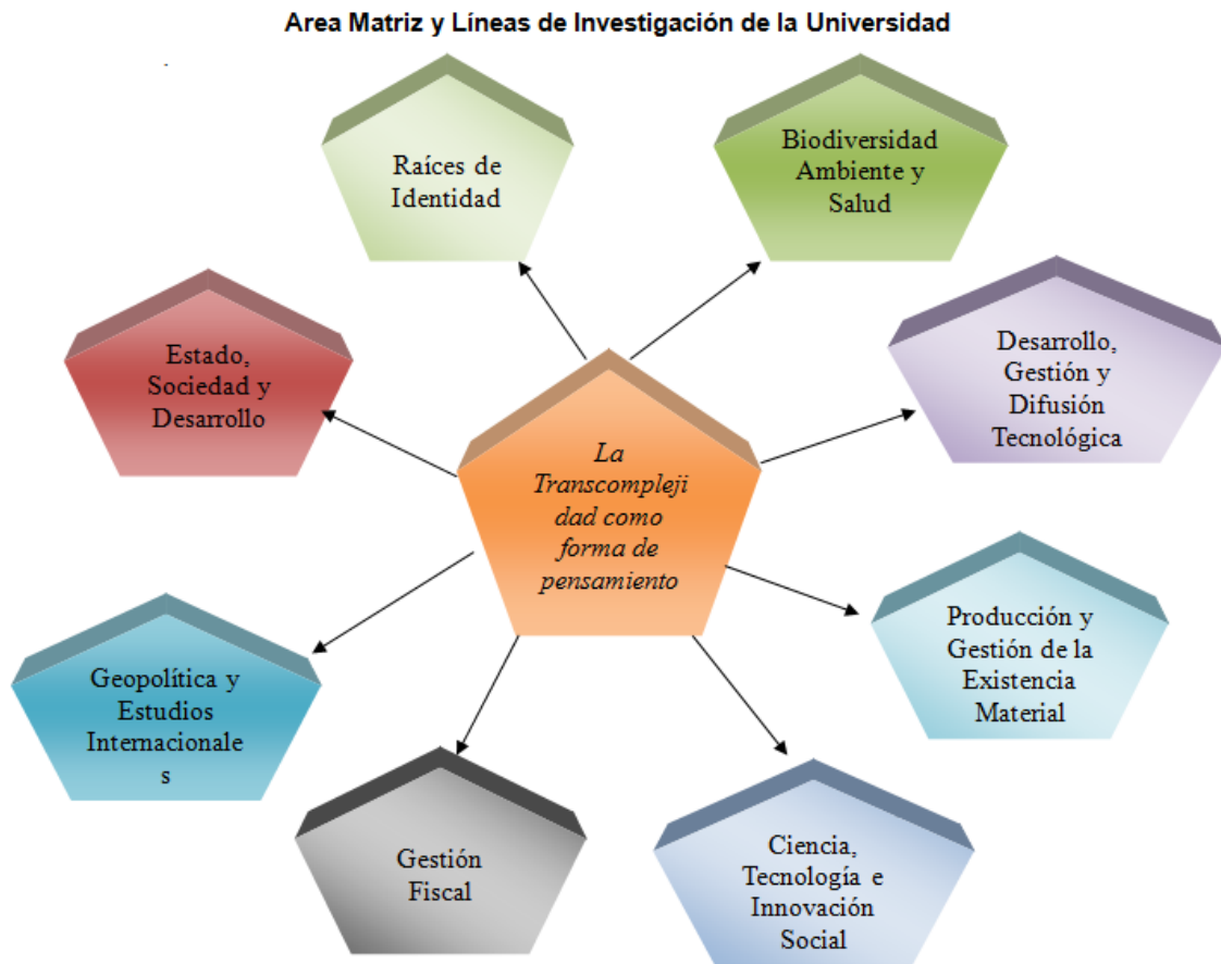
Gráfico 1. Área y Líneas de Investigación.

generar nuevos conocimientos, aplicaciones tecnológicas verificables mediante publicaciones, registros, normas sociales u otros indicadores de productos de investigación según lo define el Sistema Nacional de Ciencia y Tecnología.