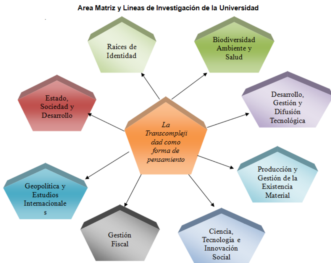
Gráfico 1. Área y Líneas de Investigación.

Sus alcances y desarrollos materiales de las prácticas y saberes involucrados son transversales a los Proyectos y deben conducir a generar nuevos conocimientos, aplicaciones tecnológicas verificables mediante publicaciones, registros, normas sociales u otros indicadores de productos de investigación según lo define el Sistema Nacional de Ciencia y Tecnología.