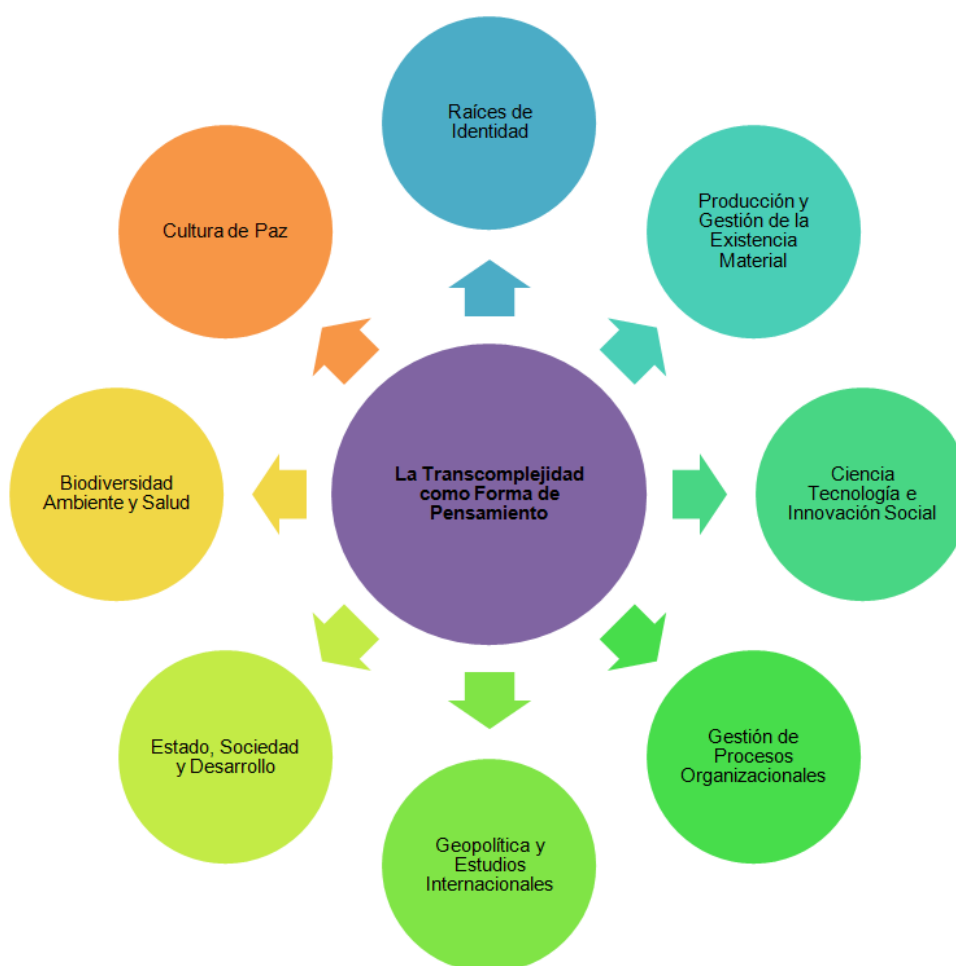
Gráfico 1. Área y Líneas de Investigación.