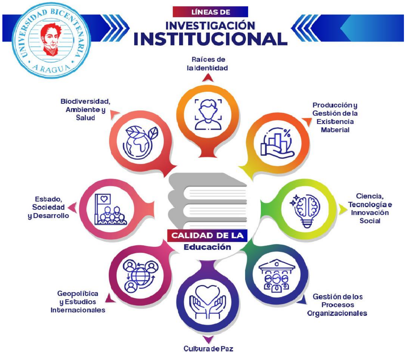
Gráfico 1. Área y Líneas de Investigación.