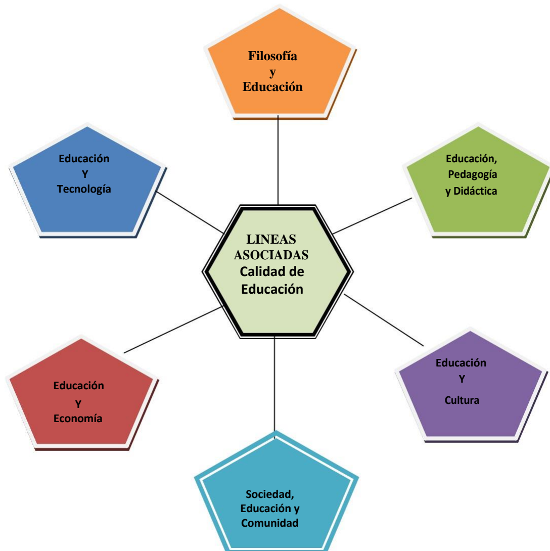
Gráfico 2. Líneas de Investigación del Doctorado en Ciencias de la Educación.